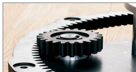
System kół zębatych dla większej mocy