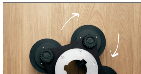
Cylindryczne głowice druciane odgarniają miękkie drewno

W celu łatwego, nieograniczonego kierunkiem szrotkowania i szlifowania, Bona Power Drive NEB należy stosować razem z Bona FlexiSand 1.9. Dzięki mocnemu silnikowi maszyny FlexiSand 1.9 kW zapewnia doskonałe wyniki.