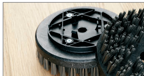
Mocowanie „na klik”